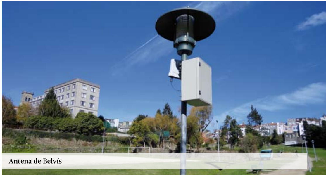
Antena de Belvís

Estes traballos foron desenvolvidos pola empresa COLABORA INGENIEROS, SL e consistiron na instalación dunha rede de puntos wi-fi que se integran na rede de telecomunicacións municipal no caso dos puntos en