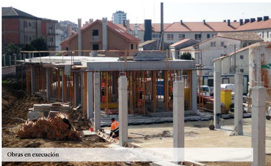
Obras en execución

Coa construción e equipamento destas instalacións contribúese a un dos obxectivos fundamentais do proxecto URBANA SANTIAGO NORTE, que é a mellora dos equipamentos dos barrios da zona norte e con iso facilitar a igualdade de oportunidades entre todos os cidadáns de Compostela.