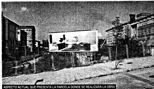
ASPECTO ACTUAL QUE PRESENTA LA PARCELA DONDE SE REALIZARÁ LA OBRA

GRUPO ARIAL WEB: www.grupoarial.es TELÉFONO: 981 569 906